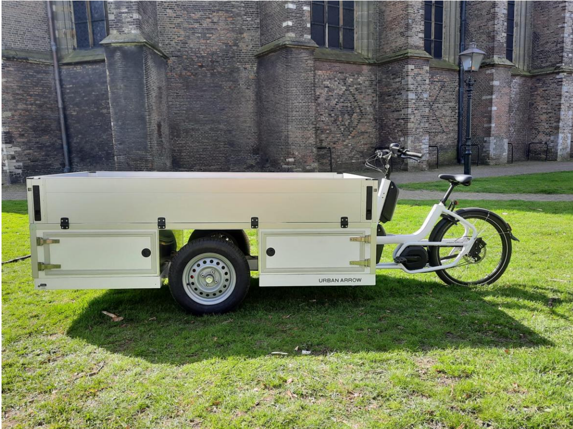
Figuur 2 de theaterfiets, het mobielpodium, de MHD Buitenbühne, het kleinste rijdende podium van Nederland

Deze fiets maakt ons mobieler, wendbaarder en zichtbaarder voor meer dan alleen de vertrouwde en gekoesterde theaterganger.