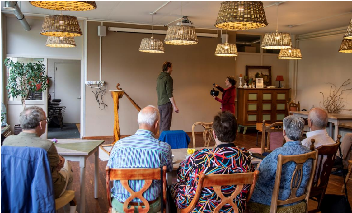
Figuur 3 de ROADSHOW 800 speelde meer dan 30 voorstellingen op unieke locaties in Dordrecht