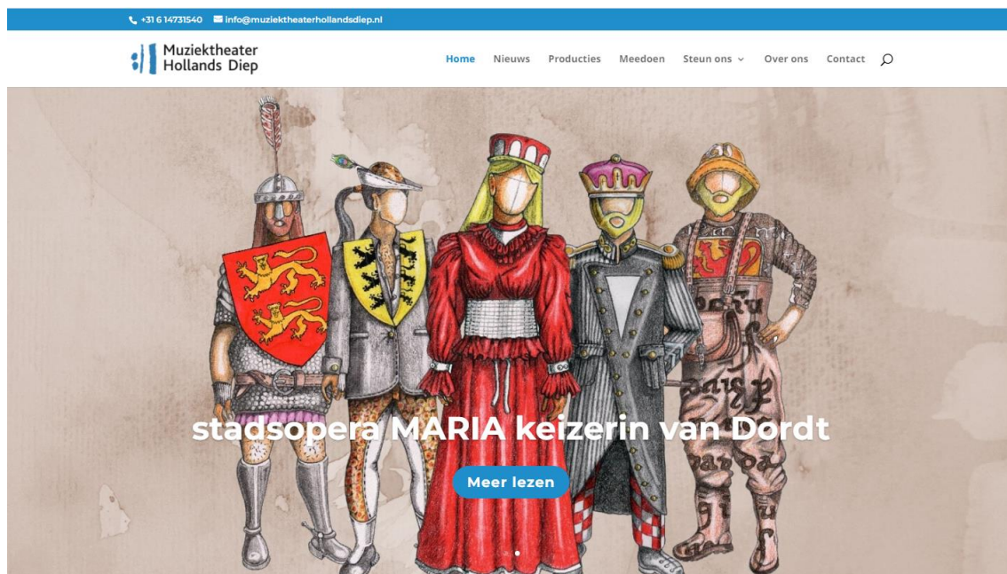
Figuur 1 de nieuwe vormgeving van de website

Sinds juli 2021 is Muziektheater Hollands Diep ook aangesloten bij Google Analytics, waardoor het mogelijk is om statistieken te analyseren. In de periode van 1 juli 2021 tot 31 december 2021 heeft de website www.muziektheaterhollandsdiep.nl 1.700 unieke bezoekers gehad. De piek lag in augustus, de periode van de Zomeropera.